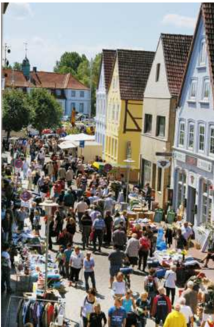
Auf dem beliebten Flohmarkt kann jeder Sachensucher und Trödeliebhaber etwas Besonderes finden