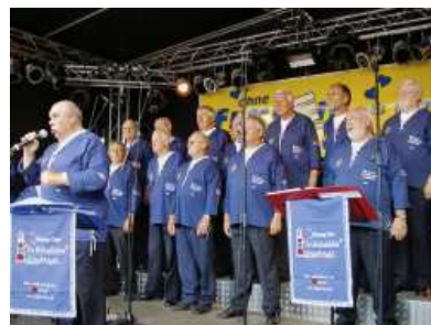
Shantiesinger dürfen zu den Feierlichkeiten natürlich nicht fehlen