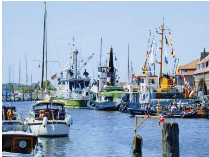
Open-Ship im Glückstädter Hafen – gehen Sie ruhig mal an Bord